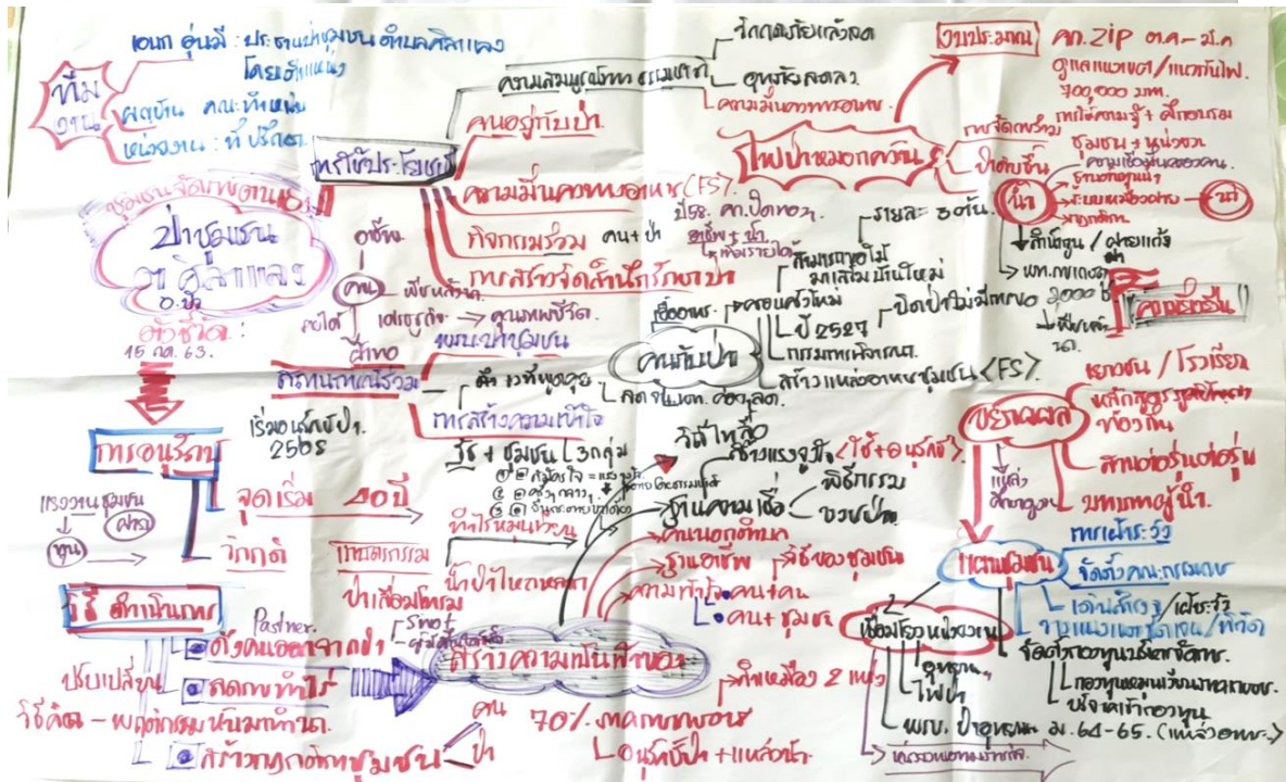
รูปที่ 7 แผนที่ความคิดเครือข่ายป้าชุมชนตำบลศิลาแลง อำเภอบัว จ.พิจิตร